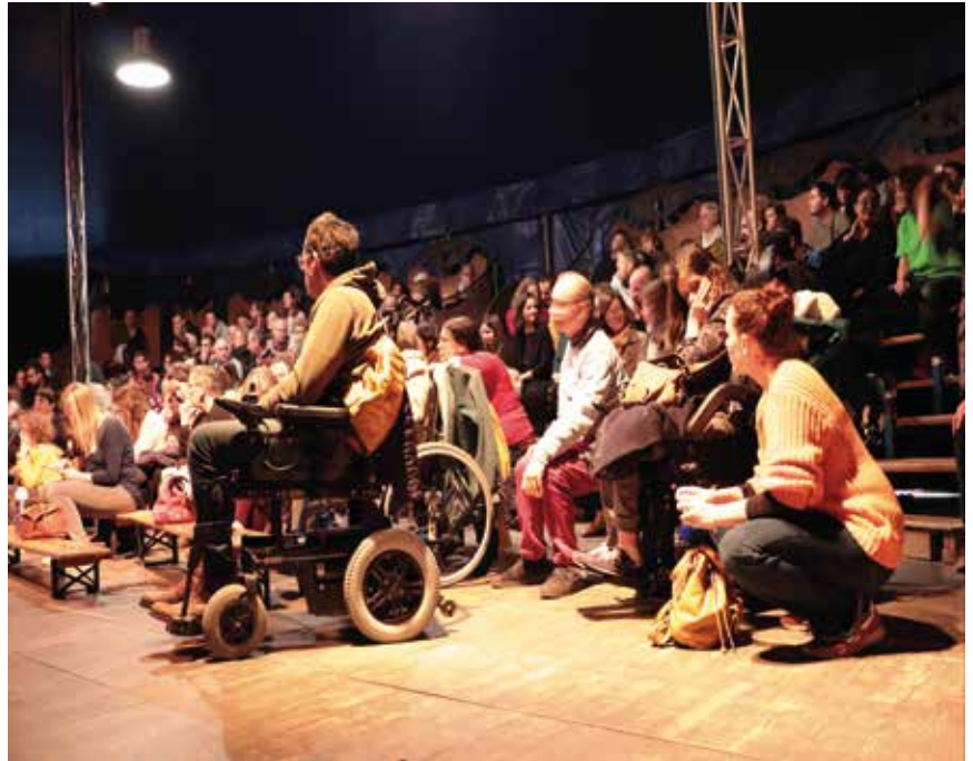
Photographies du festival Handiclap 2022, à Nantes

Handiclap est un festival de danse, de théâtre, de musique.