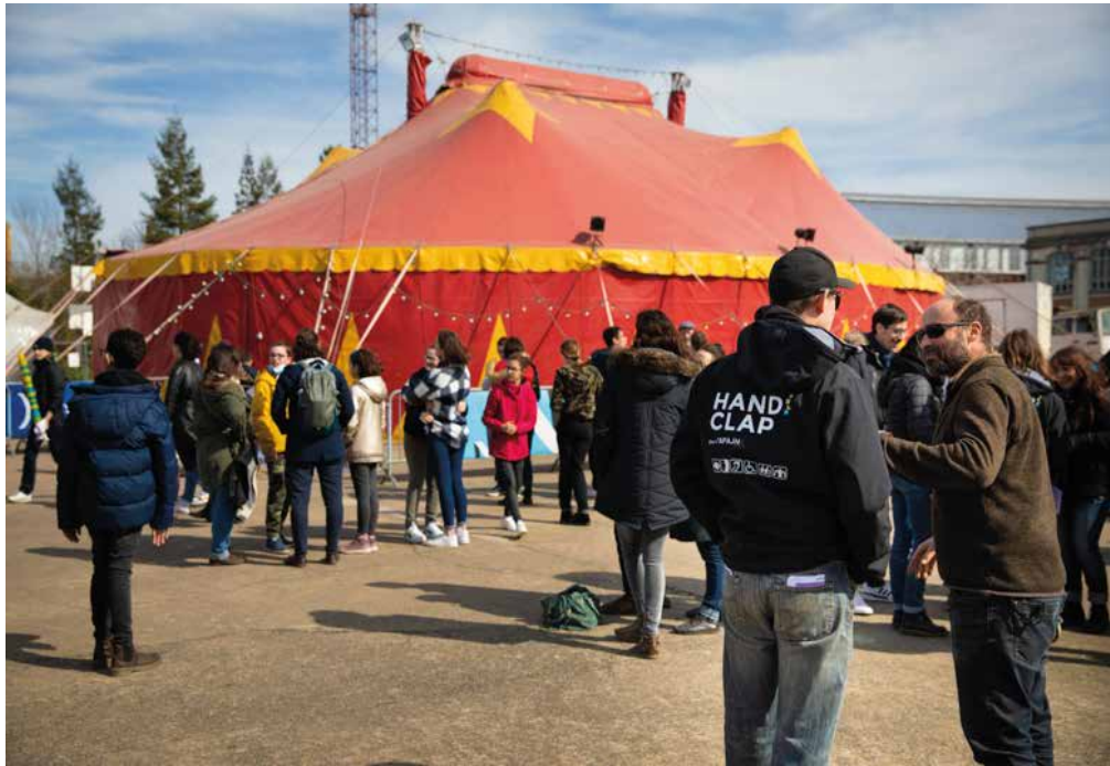
Photographie du chapiteau au festival Handiclap 2022